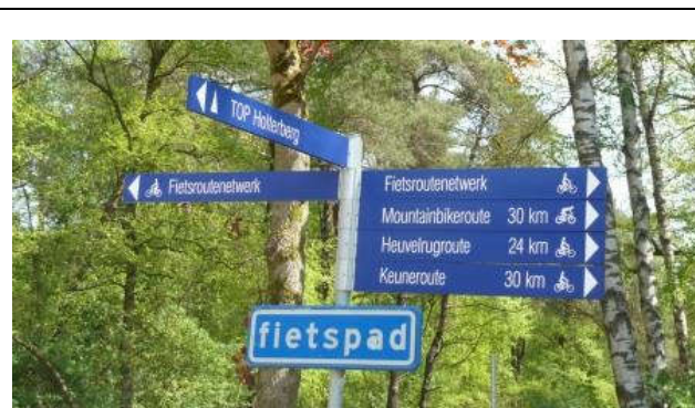
Halverwege de route